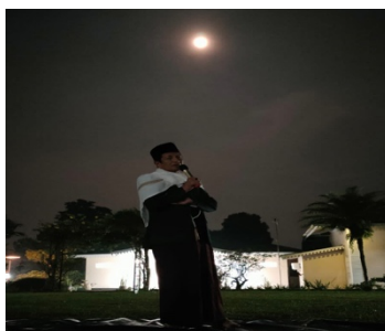
Gambar 2. Bersahabat dengan Malam

Bersahabat dengan malam merupakan tahapan ketiga. Bersahabat dengan malam dilakukan di tengah lapangan dengan menyaksikan langsung indahnya bulan di tengah malam. Pada sesi ini, seluruh peserta berbaring dan menatap bulan dan bintang yang ada di bumi. Mereka secara intens memerhatikan gerakan dan konetivitas antara satu bintang dengan bintang yang lain. Dalam sesi ini, Prof. mengarahkan seluruh peserta untuk bersahabat dan merasakan langsung keindahan bintang yang ada di langit di tengah malam.