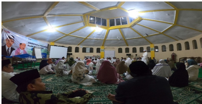
Gambar 5. Muhasabah

Pada pukul jam 2 malam, rangkaian tahapan ketiga dimulai, yaitu qiyamullail (salat malam) dan muhasabah. Qiyamullail adalah salat tasbeeh dan salat tahajjud empat rakaat. Sementara muhasabah lebih menekankan pada mengingat orang-orang yang telah berjasa dan mengirimkan surah al-Fatihah satu persatu, seperti baginda Rasul, guru, orang tua dan sahabat. Dalam proses ini, sejumlah kesan dan nilai yang dirasakan oleh para peserta sebagai berikut.