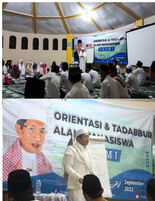
Gambar I. Penguatan Konsep