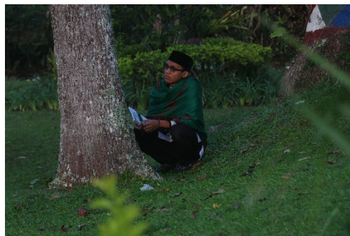
(MSR) Semut batu