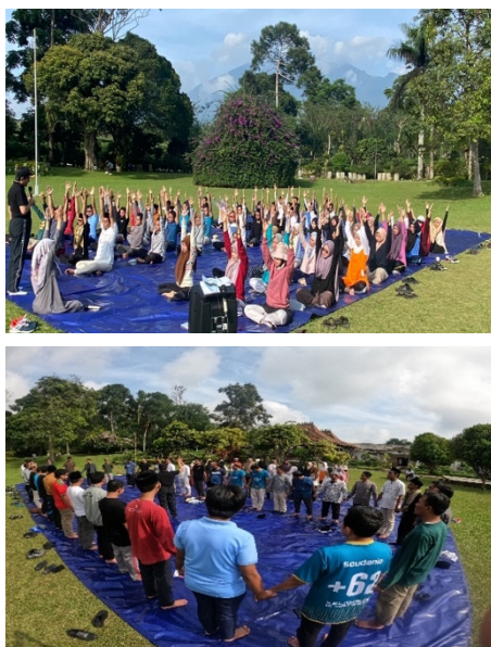
Gambar 4. Sinergi energi